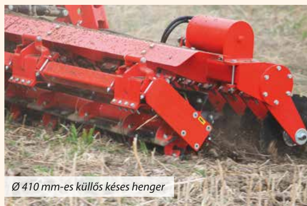
Ø 410 mm-es küllős kések henger