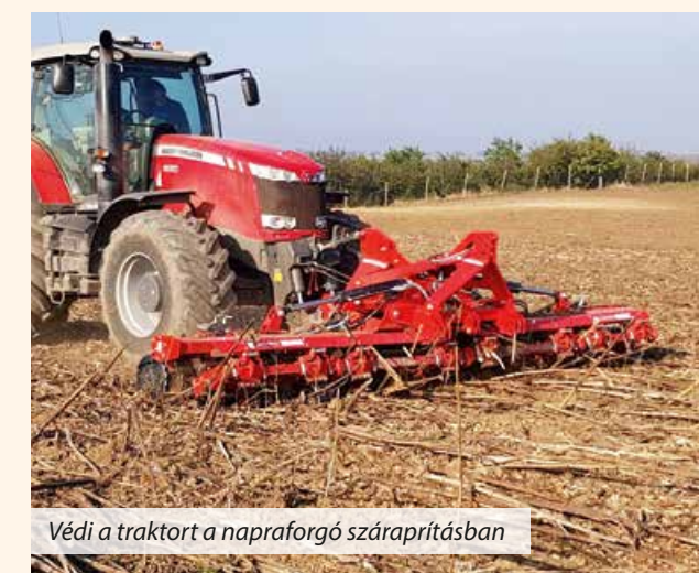
Védi a traktort a napraforgó száraprításban

Figyelem: a GLADIATOR III késes henger használatához a traktoron 1 pár kettős működésű hidraulika kör szükséges. A GLADIATOR IV, IVL, V, VI és VI-6 használatához 2 pár kettős működésű hidraulika kihelyezés szükséges.