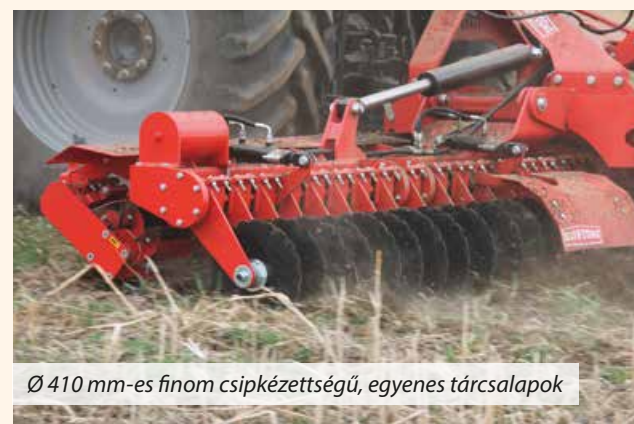
Ø 410 mm-es finom csipkézetségű, egyenes tárcsalapok