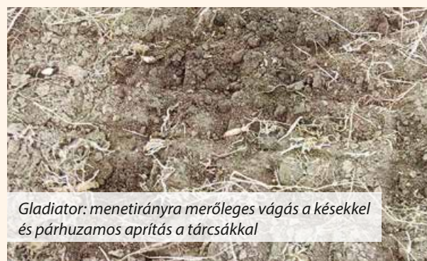
Gladiator: menetirányra merőleges vágás a késekkel és párhuzamos aprítás a tárcsákkal

A mai korban működő mezőgazdasági vállalkozások egyik fő feladata a felhasználható energia és munkaerő szükséglet alacsony szinten tartása és a napi munkavégzés időhatékony megszervezése. Ezen alapelvekkel összhangban történt a Gladiator III - VI-6 fejlesztése. A robusztus felépítésű késes henger - tárcsa kombináció vonzó megoldást kínál az egyszerű, gyors és költséghatékony munkavégzésre. Kevesebb munkamenet: a frontra függesztett Gladiator kombinálva tárcsával, grubberrel vagy egyéb munkaeszközzel vetésre kész talajfelszínt érhetünk el. Költségkímélő megoldás az elérhető nagy munkasebesség, illetve területteljesítmény az alacsony vonóerő igény mellett. A szárazúzóhoz képest jelentősen alacsonyabb energia felhasználás és nagyobb munkatempó. Hosszú élettartam a karbantartást nem igénylő csapágyakkal és a robusztus, egyedi tárcsafüggesztéssel. Hatékonyság: a csipkézett tárcsalapok aprítják a szármagványokat és egyidejűleg enyhén keverik is a földdel, így elősegítve a lebomlást.